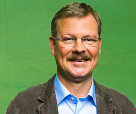
Nickel v. Neumann